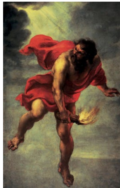
Op dit schilderij van Jan Cossiers staat Prometheus afgebeeld die ter compensatie en bij gebrek aan natuurlijke eigenschappen vervolgens het vuur stal voor de mens. Dit vuur staat symbool voor de techniek.

Bernard Stiegler (1952 - 2020) was een Frans filosoof en publicist die zich vooral interesseerde voor techniek filosofische vraagstukken (Lemmens, 2019). Hij gaat nog verder terug in de geschiedenis en wijst de steentechnieken aan als de eerste vormen van techniek. Omdat in de steen een ervaring zat 'ingeschreven', werd het mogelijk om deze ervaring indirect over te dragen. De opeenvolgende generaties hebben de techniek zo steeds verder van steen en speerpunt tot en met de technieken in deze huidige tijd weten te ontwikkelen. In zijn optiek co-evolueert de mens met zijn techniek en kan techniek als tweede natuur gezien worden. De mens is een technisch wezen, is afhankelijk van techniek en wordt erdoor geconditioneerd. Stiegler verwijst daarbij naar de mythe van Prometheus en Epimetheus. In deze mythe is het Prometheus die de levende wezens schiep. Epimetheus, tweelingbroer van Prometheus kreeg daarbij de taak verschillende eigenschappen aan deze wezens toe te kennen, maar was vergeetachtig. Hij plaatste de figuren met hun natuurlijke eigenschappen op de aarde, maar vergat daarin de mens mee te nemen. Op het moment dat de mensfiguren aan de beurt waren, waren er geen eigenschappen meer over, zoals we die zien bij dieren in hun snelheid, slimheid, vleugels, kracht etc.