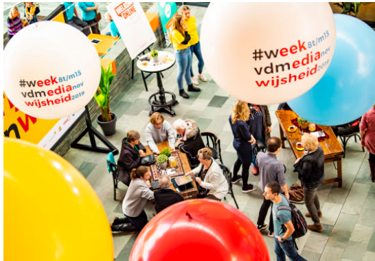
Bezoekers in Welkom Online Café