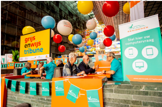
Vrijwilligers SeniorWeb helpen ouderen op Grijns en Wijs Tribune